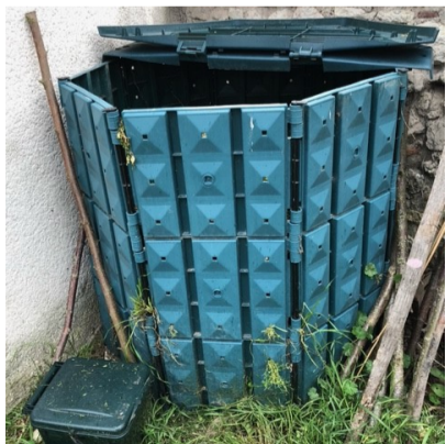
Composteur dans le jardin partagé à Sainte Thorette.

La Communauté de Communes Cœur de Berry favorise cette action citoyenne en proposant aux habitants du territoire des composteurs en plastique de 600 L à monter soi-même pour un montant de 20 Euros. Réservez le vôtre au 02-48-51-13-73.